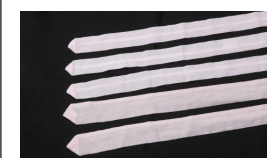
腰ひも 5 本