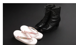
草履またはブーツ