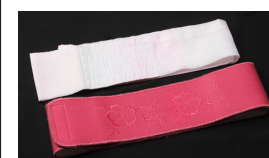
伊達締め 2 本