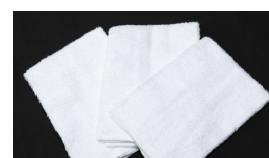
補整用タオル 3 本 (薄手のもの)