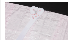
長襦袢 (かならず半襟をつけてお持ちください)