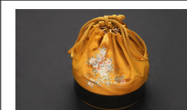
バッグ (なくても可)