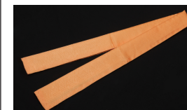
重ね衿 (なくても可)